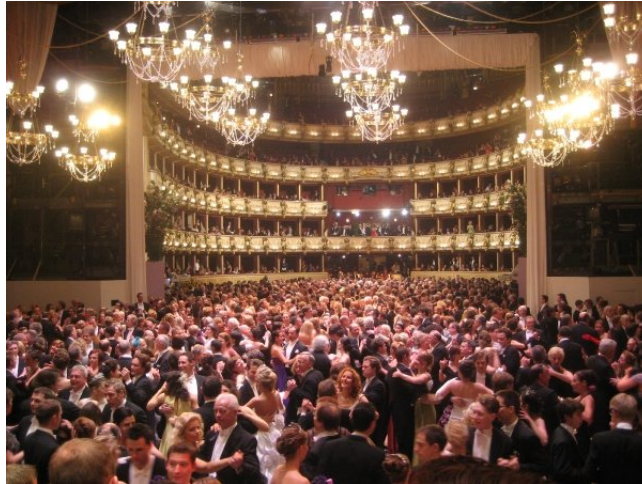
Танцы в разгаре!

пригласить остальных гостей на паркет звонкой фразой "Alles Waltzer"! Быть дебютантом оперного бала это большая ответственность, открывать этот Бал можно только один раз в жизни и вы должны быть не моложе 17 и не старше 25 лет. Но на первом вальсе роль дебютантов не ограничивается. Для начала, надо красиво войти в зал под полонез. Потом, после окончания выступлений других артистов, следует танец с перестроениями - полька. И только в конце церемонии заветный вальс!