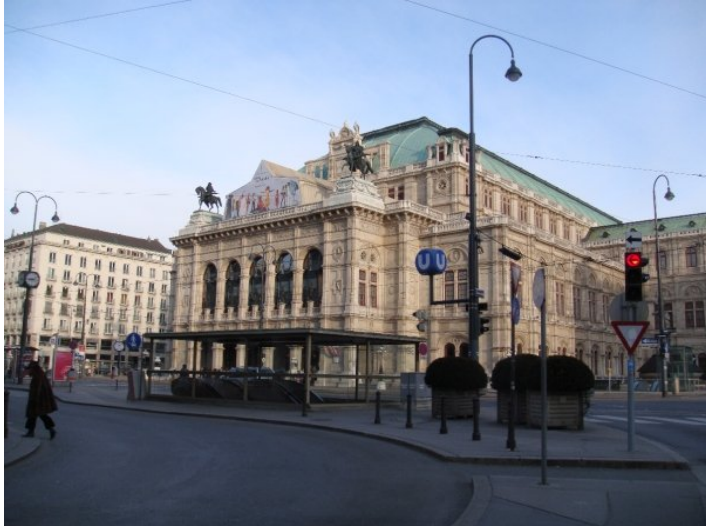
Vienna State Opera

Для дебютанта, Венский Оперный Бал начинается задолго до церемонии его открытия. С того самого заветного момента, когда дебютант получает письмо с приглашением от организаторов, в его жизни начинается обратный отсчет - 3 месяца до бала, один месяц, неделя, день, час, и вот та самая минута! Жизнь проходит в предвкушении грядущего сказочного вечера и наполняется приятными заботами - тренировки вальса, просмотр записей балов прошлых лет, поиск фрака, лакированных туфель и так далее. Ваши дни начинают проходить