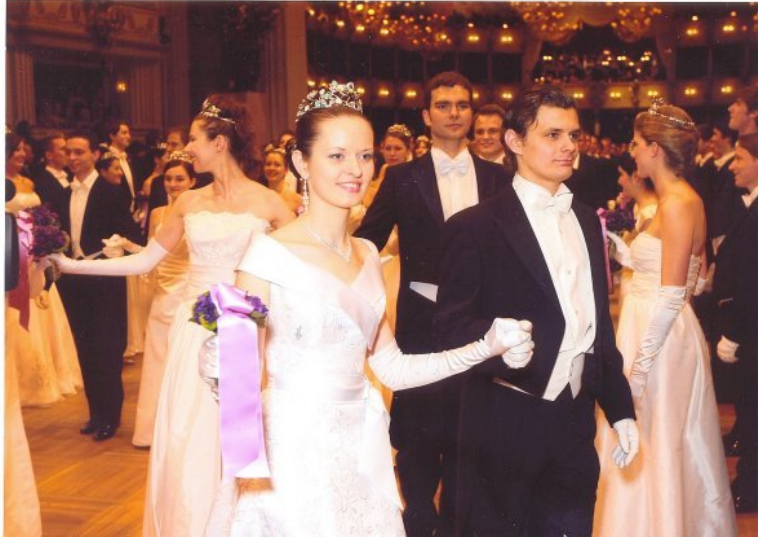
Церемония открытия. Полонез.