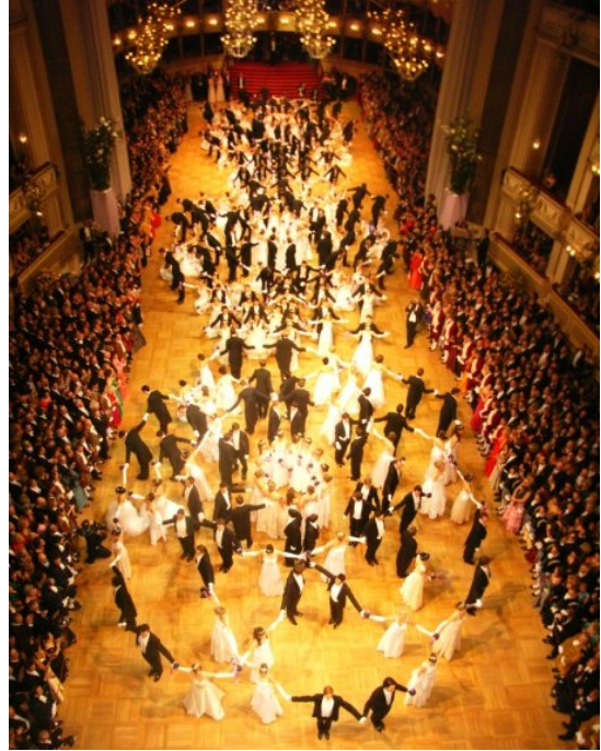
The Flower of Love

Все репетиции проходили в здании оперы, но только за день до Бала нам устроили генеральную репетицию в основном зале Венской Оперы с живым оркестром. Оказывается, на неё тоже продаются билеты, и много родственников и друзей дебютантов приходят поддержать их.