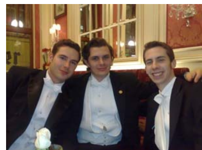
Утро после Бала. Hotel Sacher.